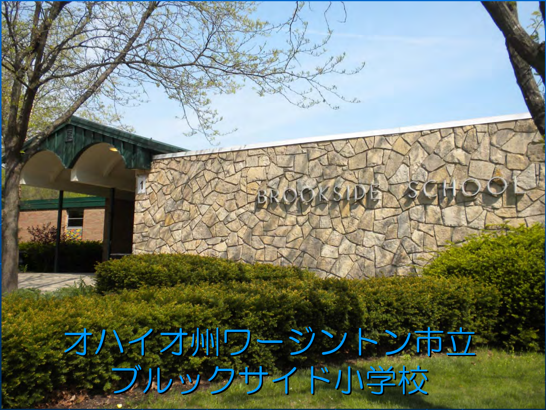
オハイオ州ワージントン市立 ブルックサイド小学校